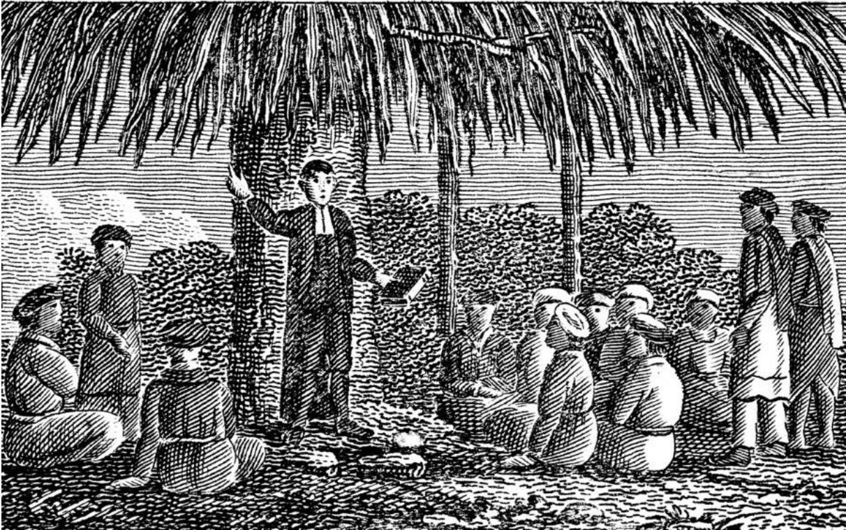
Stereotypisk bilete av misjonæren?