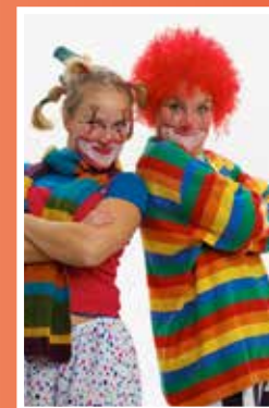
Tipp og Topp

Kl. 17.00 Familieforestilling: «Matpakken – mat for hjertet» med klovnene Tipp og Topp. (Søstrene Trøtteberg) Tipp og Topp er to klovner som tuller og tøyser og prøver å trylle! De lurar på mye rart og prøver de å finne ut av små og store spørsmål sammen med barna i salen. Klovnenes lekenhet, nysgjerrighet og ganske naive spørsmål er utgangs-